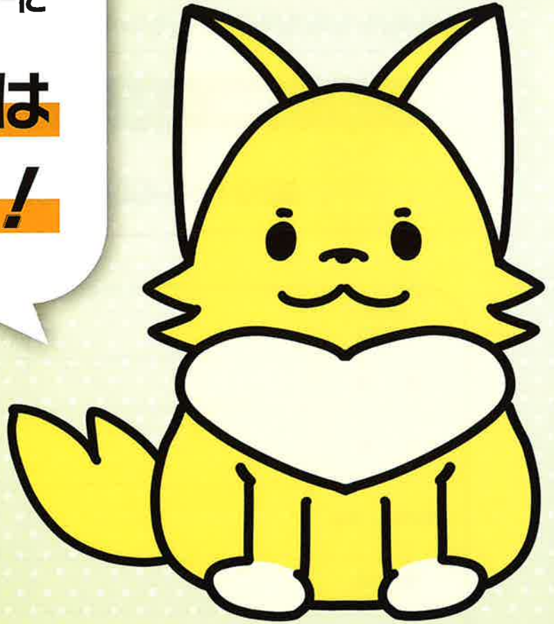
愛知働き方改革推進支援センター公式キャラクター