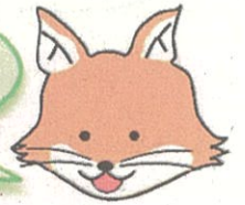
不動産登記推進 イメージキャラクター 「トウキツネ」